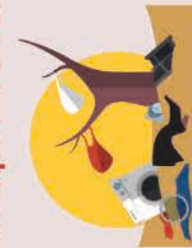
Dégradation du paysage