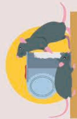
Développement de maladies et attirance des animaux (rats, chiens)