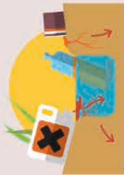
Pollution des eaux, des sols et de l'air