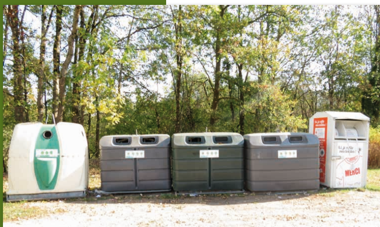
P.A.V rue de la Courbe